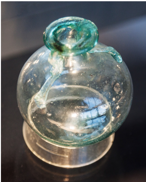
Museum Ceuculum.

Uiteraard werd ook de naastgelegen, recent geopende, museumtuin bezocht met een expositie van stenen en andere Romeinse overblijfselen, een zandontdekkingstafel en een rondzit in de Romeinse tuin waar zich ook een replica van een Romeinse tempel bevindt.