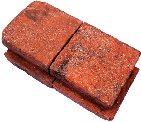
Afb. 3. Gebakken rode Coreman stenen, gebruikt als dijkbekleding op Schouwen.