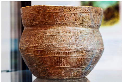
Museum Ceuclum.

Analyse van sporen op vondsten van de (her)gebruikte brugfunderingsste-