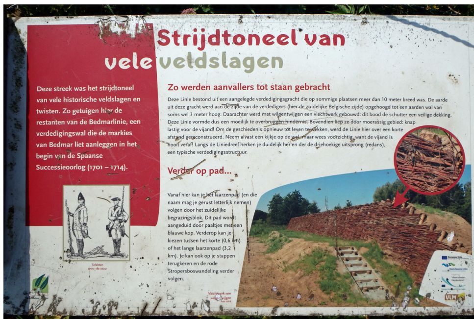
Infopaneel bij de Bedmarlinie in het Stropersbos.

In de loop van de tijd zijn veel onderdelen van de linie geslecht en herinneren alleen nog een vreemde kronkel van een sloot, een verhoging in een