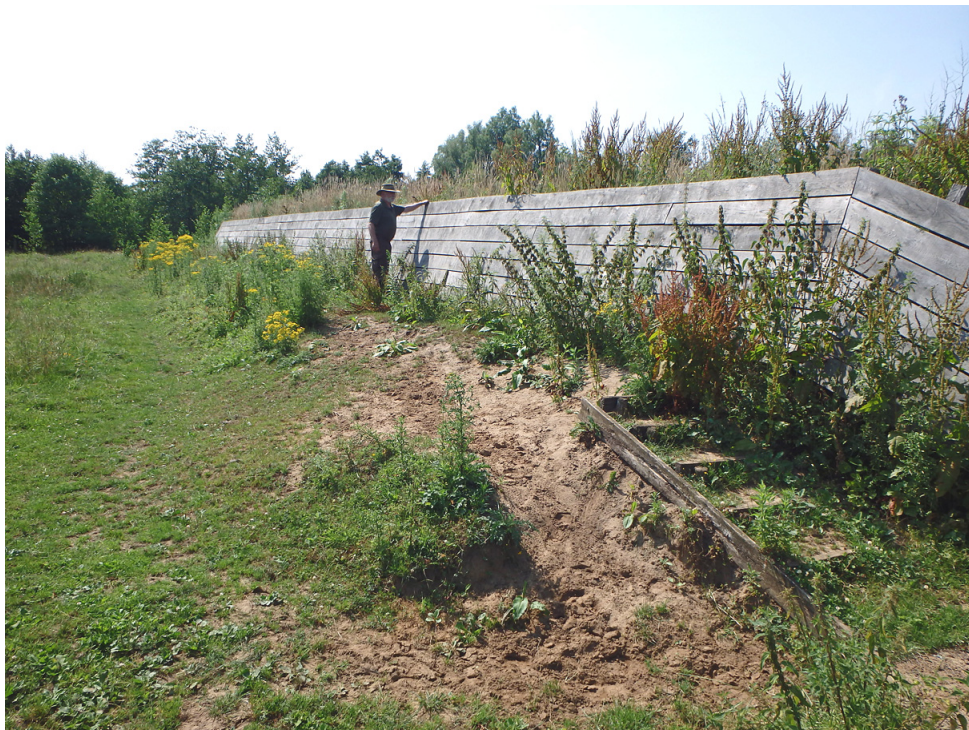
Binnenzijde van de gedeeltelijk gerestaureerde wal.

plaats stond waar men Fort Bedmar gepland had zonder meer in beslag genomen en de wettige eigenaar gedwongen te vertrekken. En het graven van de grachten en het opwerpen van de wallen van het fort werd uitgevoerd door enkele honderden dwangarbeiders. Dat scheelde weer in de kosten.