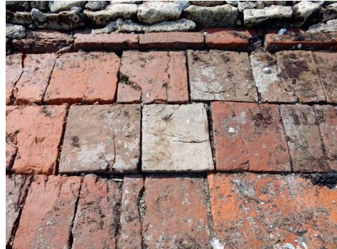
Afb.4. Foto gebakken Coreman stenen in de zeedijk van de haven "de Val".

(6) Na de storm van 1906 ontwierp ir. De Muralt, van 1903 tot 1913 waterbouwkundig ingenieur op Schouwen, de ons bekende betonnen De Muraltmuurtjes. Dit was een goedkope manier om dijken te verhogen. Daarvoor had hij een dijkbescherming van beton ontworpen, de z.g. "trapjesglooing". Later kwam daar nog bij de "spijkerlooingen" bestaande uit vierkante betonplaten die met een z.g. betonnen spijker op de dijk werden vastgezet.