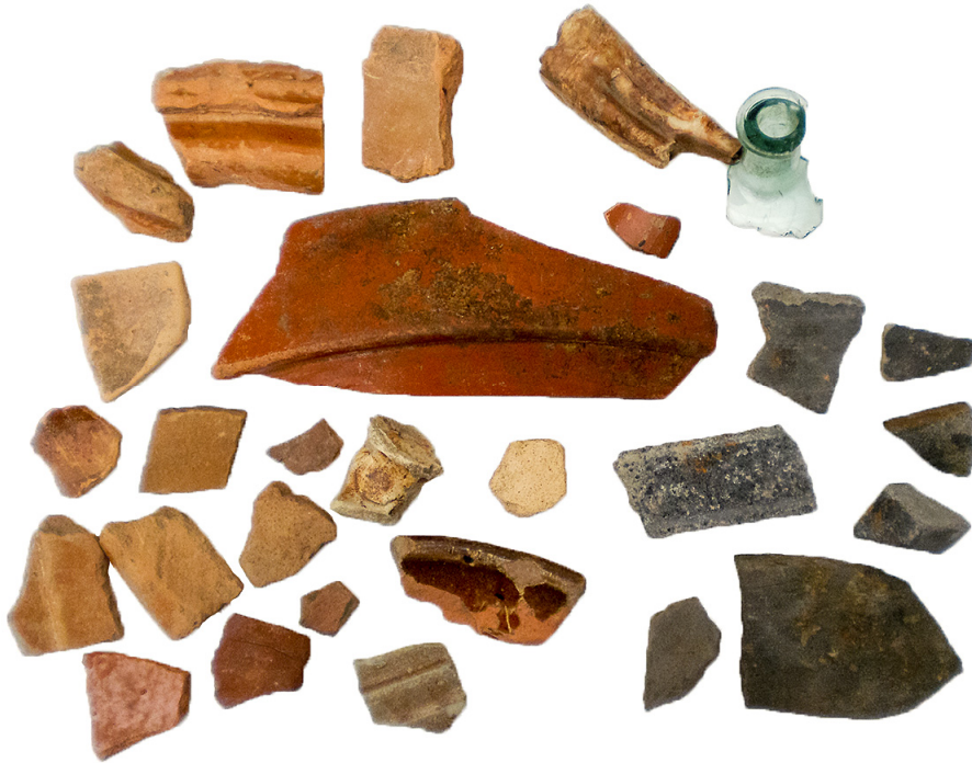
Resultaat veldlopen in de Smokkelhoek, Kapelle-Biezeling.

Aad Bruins en Dicky de Koning hebben gewerkt aan een lesprogramma in het Stadhuismuseum in Zierikzee. In september is er een “Doeuus” week voor de scholen op Schouwen-Duiveland. Zij gaan dan naar een museum en krijgen daar educatieve lessen. Wij zullen daar archeologielessen geven met door ons samengestelde leskisten.