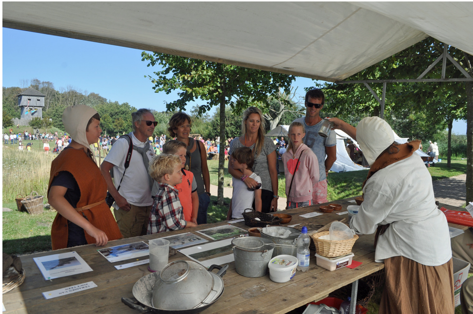
Veel belangstelling vanuit het publiek..

vijf dinsdagmiddagen achter elkaar klaar om op ‘middeleeuwse wijze’ zout te winnen uit zout veen en Oosterscheldewater.