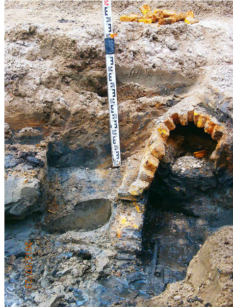
Riool 18e eeuw in Paulinastraat - Bosstraat.

Dichtbij, in de Venkelstraat en in het smalle steegje naar de achterzijde van de huizen kwamen uit oude afvalla-